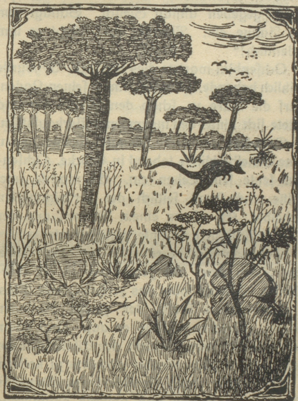
Wo ist der Australier?

Jeder Abonnent dieses Blattes, der den Australier auf obigem Bild entdeckt und nachzeichnet, dann diese Lösung an uns einwendet, erhält das prächtige Vierfarbendruckbild