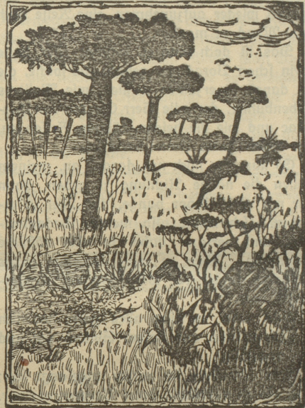
Wo ist der Australier?

Seder Abonnent dieses Blattes, der den Australier auf obigem Bild entdeckt und nachzeichnet, dann diese Lösung an uns einsendet, erhält das prächtige Vierfarbendruckbild