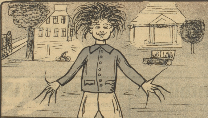
Rich. Frei: Der Strowelpeter