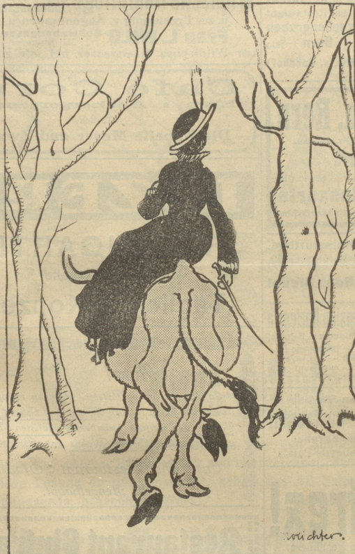
Srau Kommerzienrat „hoch zu Och“ im Berliner Tiergarten.