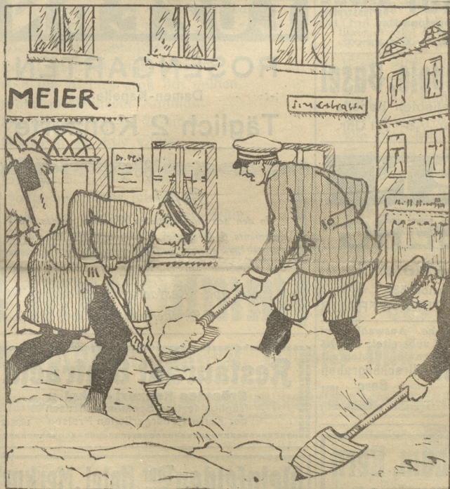
„Na, Srie, das wäre fein, wenn's für Schneeschippen auch 'ne Senfur gäbe, dann brauchte man sich wegen der Osiervorsetzung keine Sorgen zu machen!“