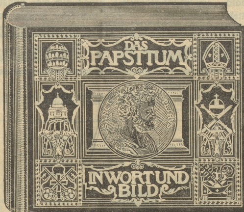
Format 34 x 22 cm, auf Kunstdruckpapier gedruckt, mit ca. 250 Bildern, in künstlerischem Einband.