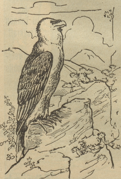
Wo ist die Beute des Geiers?

ist das Blutreinigungsmittel , dessen seit einem Vierteljahrhundert stetig wachsender Erfolg zahlreiche Nachahmungen hervorgerufen hat. Dieselben sind meistens billiger, konnten aber in der geradezu idealen Wirkung niemals der echten Model's Sarsaparill gleichkommen. Letztere ist das beste Mittel gegen alle Erscheinungen, die von verdorbenem Blut oder von habitueßer Verstopfung herrühren, wie alle Hautunreinigkeiten, Augenlider-Entzündungen, Gesichtsrotz, Jucken, Rheumatismus, Krampfadern, Hämorrhoiden, Skroflose, Syphilis, Magenleiden, Kopfschmerzen, Menstruationsbeschwerden und Störungen besonders im kritischen Alter usw. Sehr angenehm und ohne Berührung zu nehmen. \frac{1}{2} Fl. Fr. 3.50, \frac{1}{4} Fl. Fr. 5.—, 1 Fl. für eine vollständige Kur 8 Fr. — Zu haben in allen Apotheken. Wenn man Ihnen aber eine Nachahmung anbietet, so weisen Sie dieselbe zurück und bestellen Sie per Postkarte direkt bei der PHARMACIE CENTRALE, MODEL & MADLENER, Rue du Montblanc 9, in GENÈVE. Dieselbe sendet Ihnen franko gegen Nachnahme obiger Preise die echte 9100 S 1489 Model's Sarsaparill.