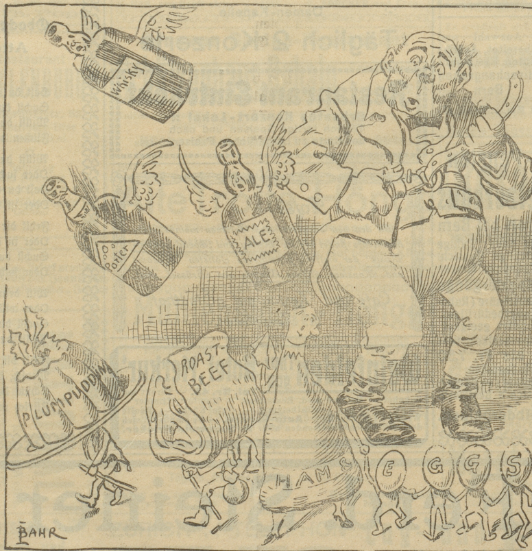
Abschied von den „heiligsten Gütern“

Die heftigsten Kopfschmerzen, Migräne, nervöse Zustände ver- schwinden nach wenigen Minu- ten durch das Migränpulver Marke BASA. Schachtel à 1 Fr. Alleinversand durch die Schwaben- Apotheke Baden (Aarg.). 1426