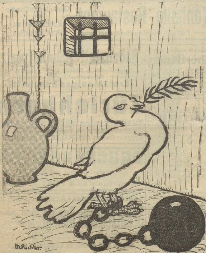
Die Entente hat einen „Befangenen“ gemacht.