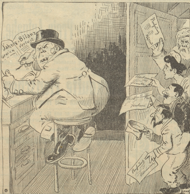
John Bull: Ein miserabler Abschluß und nun kommen auch noch die vielen Neujahrsgratulantanten!