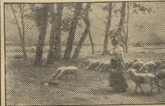
DANS LA CAMPAGNE, LEROLLE farbig, 17x28 cm . . . . . Fr. 2.75 auf Karton, 30x45 cm . . . . . Fr. 3.75

Wir ersuchen, bei etwaigen Bestellungen auf die Inserate im „Nebelspalter“ Bezug zu nehmen!