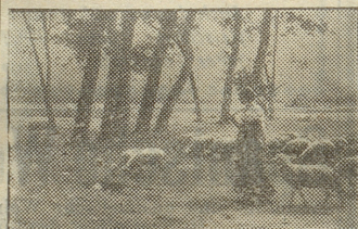
DANS LA CAMPAGNE, LEROLLE farbig, 17x28 cm . . . . . Fr. 2.75 auf Karton, 30x45 cm . . . . . Fr. 3.75

Farbige, originalgetreue Kunstblätter alter und moderner Meister der europäischen Kunstgalerien. — Ansichten, Landschaften und Volkstypen des Schweiz und aller Erdteile. — Künstlerisch gediegener Wand- u. Zimmerschmuck , für Geschenke, Sammler und Schulen.