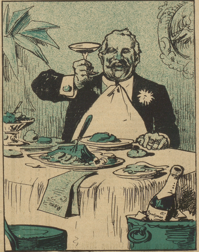
Sein Sohn — Beutelschneider Machte Gelder, als Schieber.