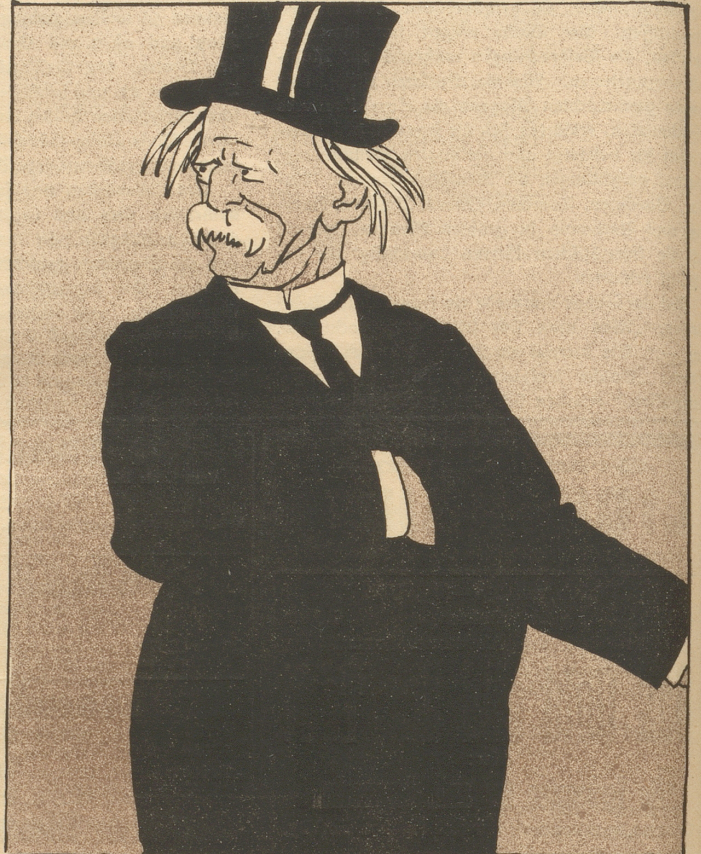
Ministern tut die Schweizerluft recht gut. Selbst Greife schöpfen neuen Latenmut!