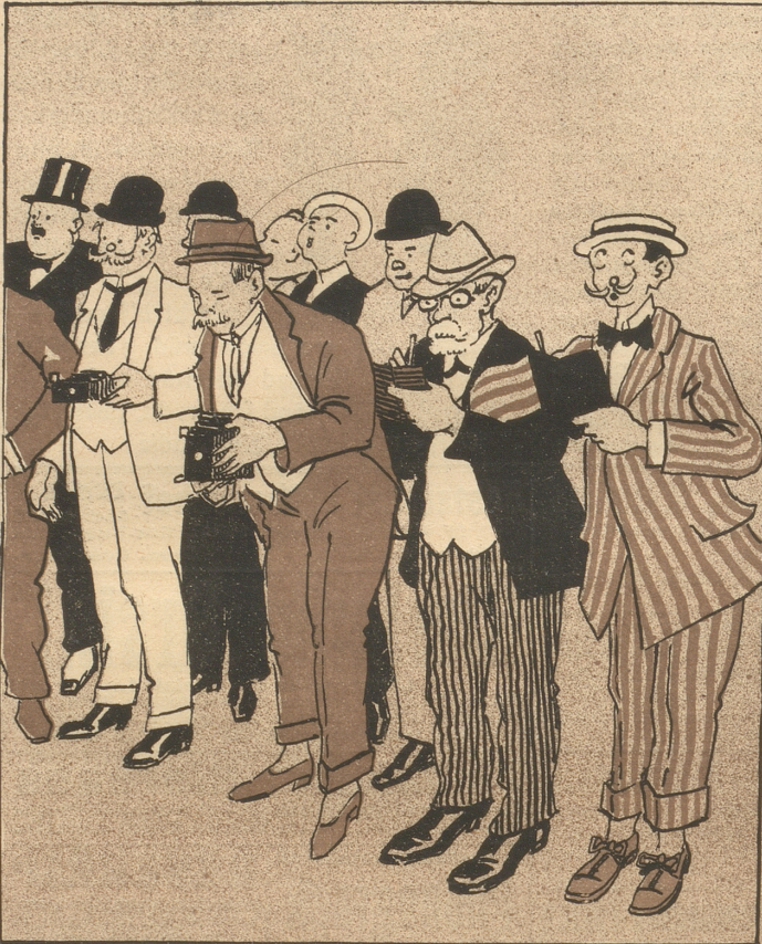
In großen Tieren fehlt's uns nicht zur Zeit; Zu ihrem Sang Reporter stehn bereit.