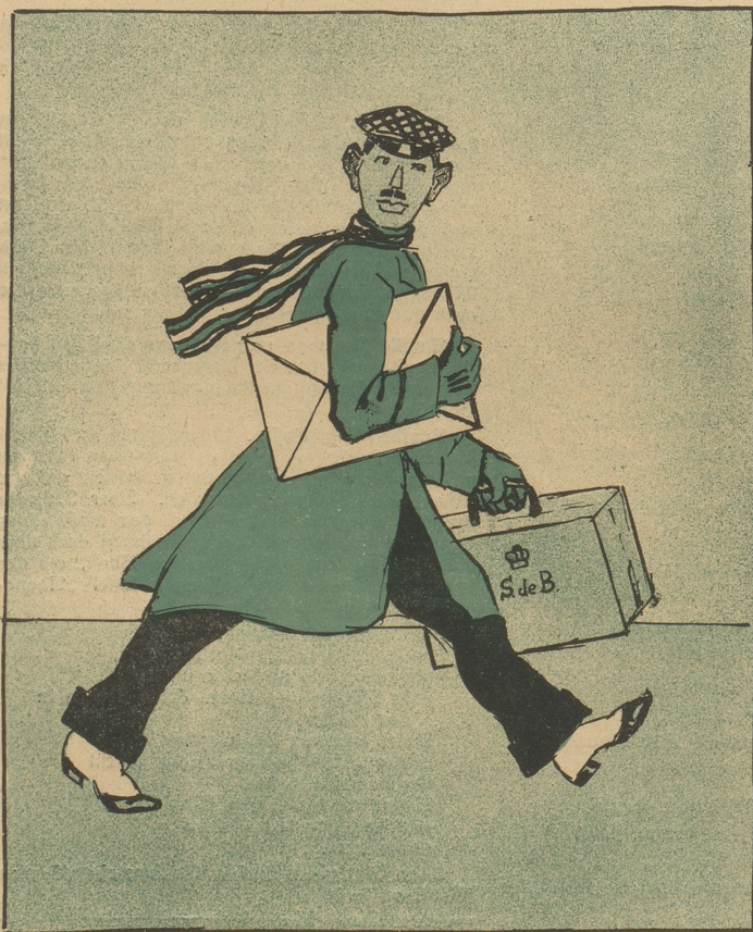
Ein richtiges Märchen ohne Prinz wär' nicht pikant, Hier naht sich Sigtus mit dem Friedensbriefe in der Hand.