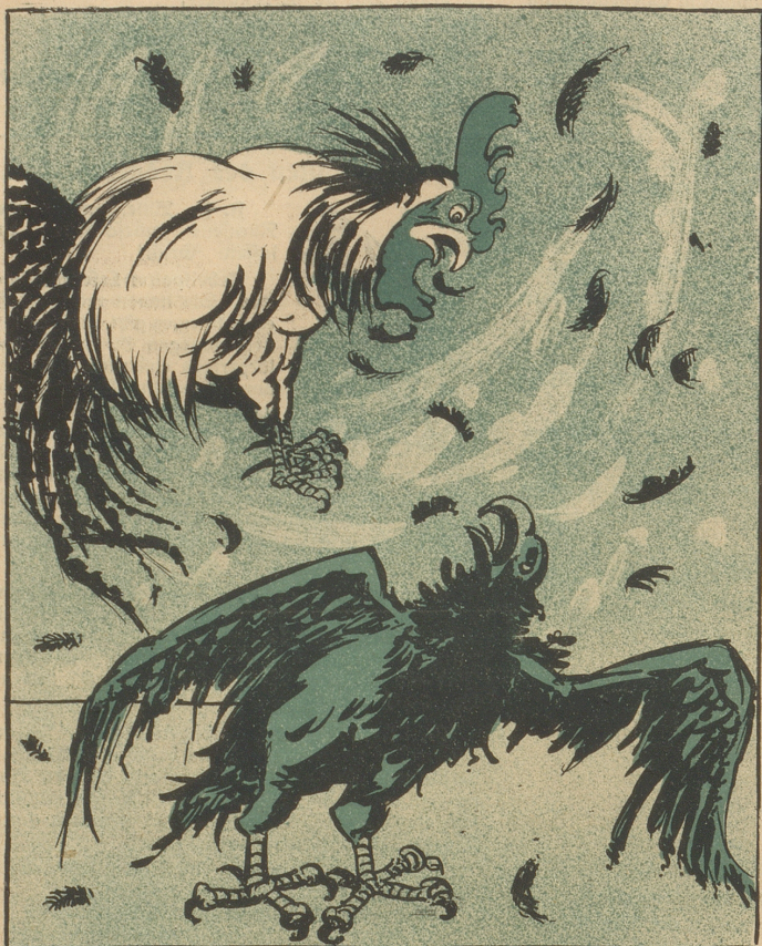
Hört zu, es war einmal ein bitterer Streit: Der Hahn und Adler hatten sich entzweit.