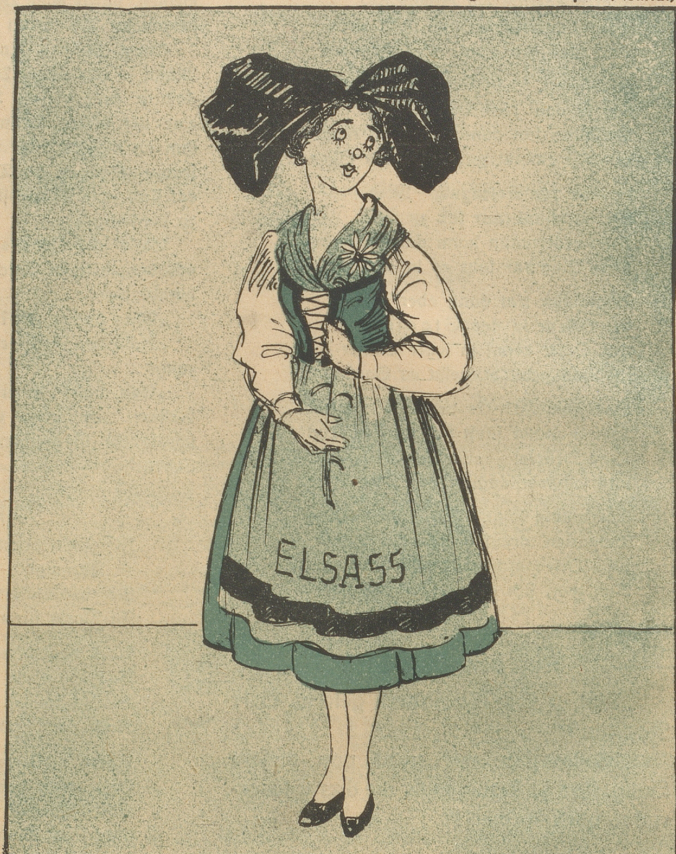
Sie kämpften um ein Mägdelein, Ein jeder wollte Sieger sein!