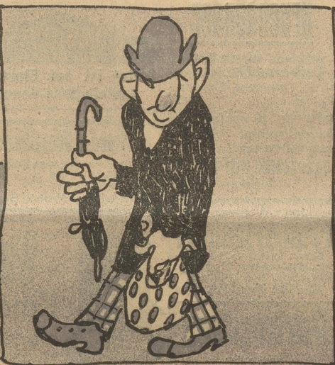
Bei diesem kühnen Stuchtversuch, Trug er's Gepäck im Taschentuch.