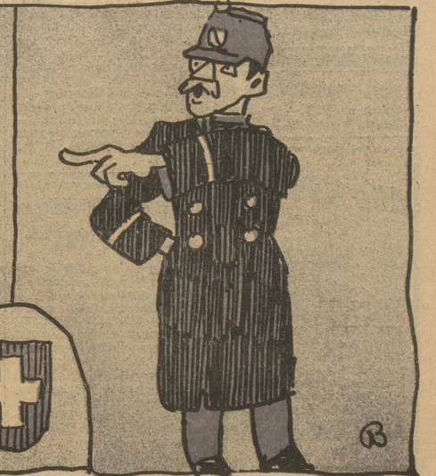
Wies aus den fetten Braten man; Der lacht' ins Säufschin sich sodann.