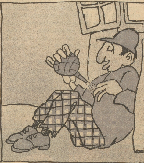
Schon früh lernt Zacherlin er schätzen, Sonst hält' gekraht er sich zu Sehen!