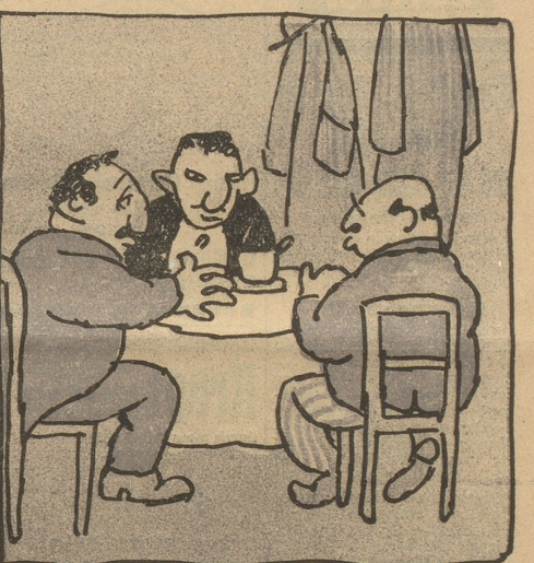
In Zürich fand er Seelenspeiß, „Von unf're Leut“ den schönsten Kreis.