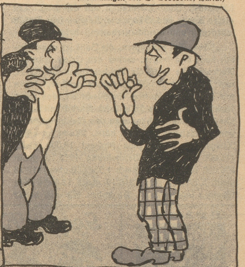
Gab's was zu handeln, von der Gop — Faste gefehn? — siets gleich dabei!