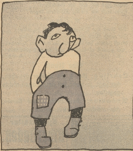
Da oben irgendwo bei Thorn Kam er zur Welt mit breiten Ohr'n.