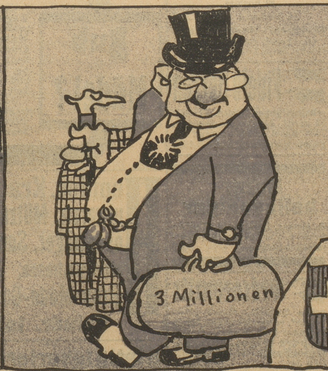
Als er die dritte Million Ergattert' sich in Zürichon —