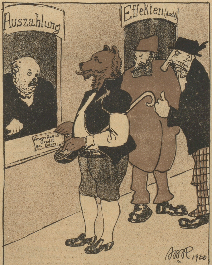
Sogar dem Berner Muß Amerika Kredit in Aussicht stellt, Vergebens nur das „rote“ Zürich nach Hilfe Umschau hält!