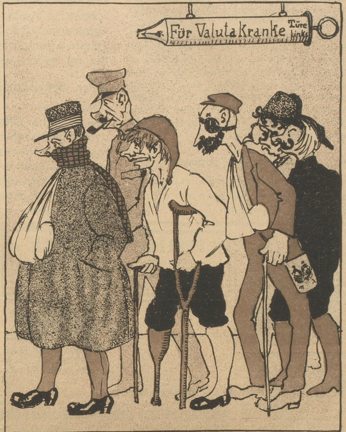
„Vor allem den Valuta-Kranken sei mit Macht“ — Meint er — „zur schnellen Heilung ein Klystier gebracht!“