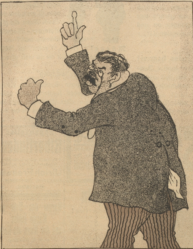
In London auf der Konferenz höchst kraftvoll und mit Schroung, Versprach Herr Millerand gar manche Aenderung.