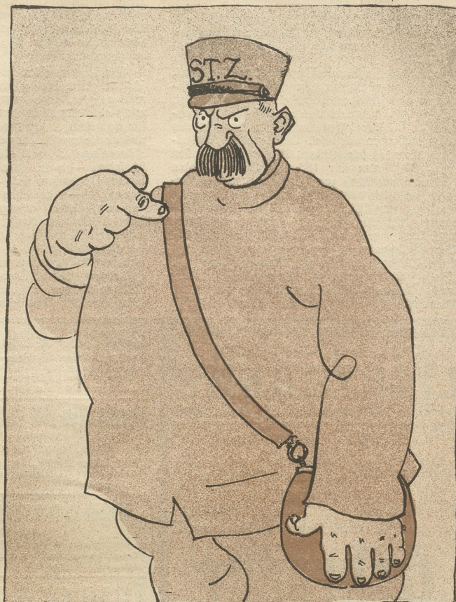
„Mich schuf aus gröberm Stoffe die Natur.“ Schiller, Wallenstein.