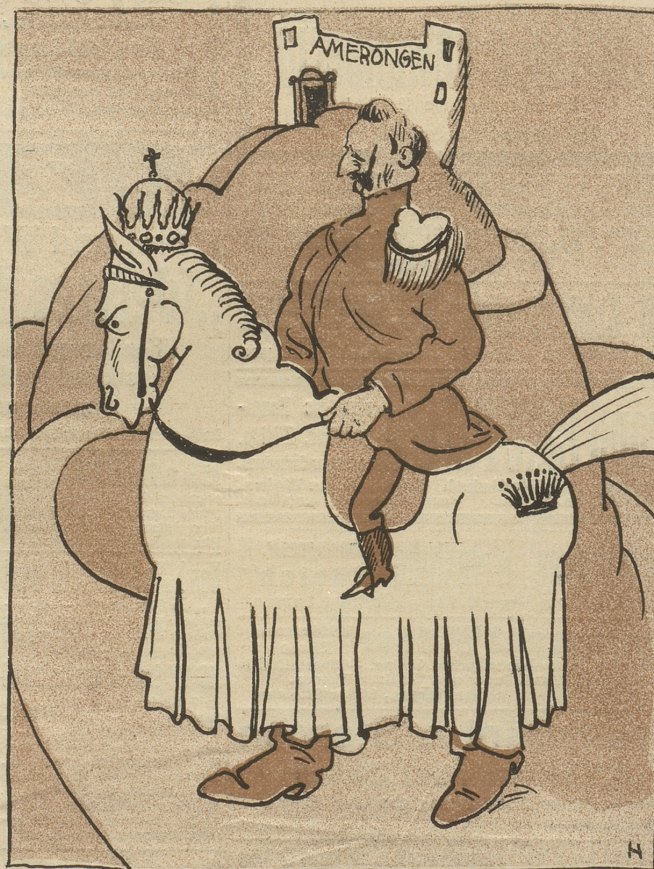
„Und Roß und Reiter sah man niemals wieder!“ Schiller, Wallenstein.