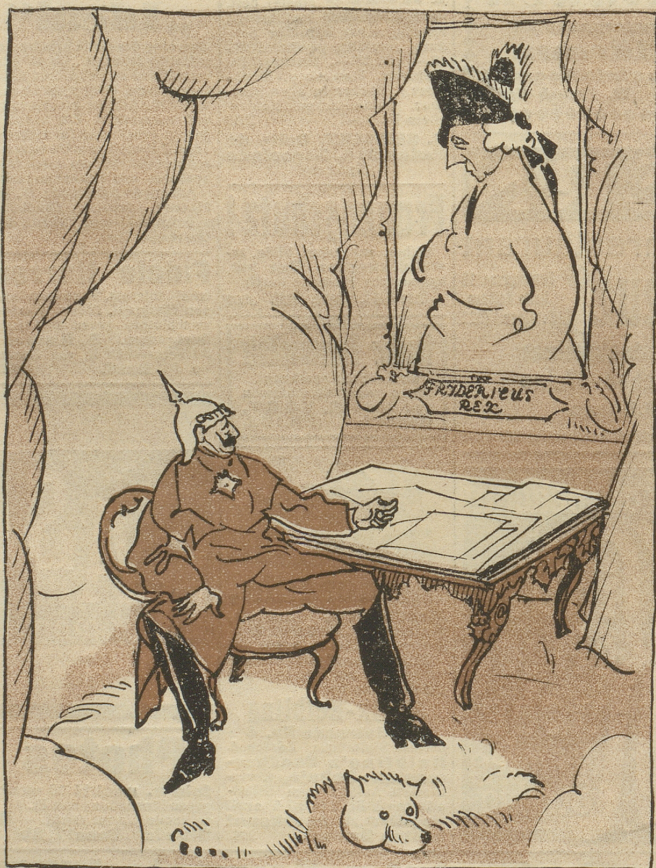
„Wie er sich räuspert und wie er spuckt, das hat er ihm glücklich abguckt.“ Schiller, Wallensteins Lager.