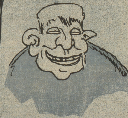
9 Nur die Dummheit trifft es nicht!