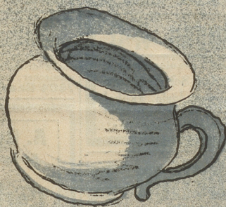
4 Besteuert wird auch dieses Ding