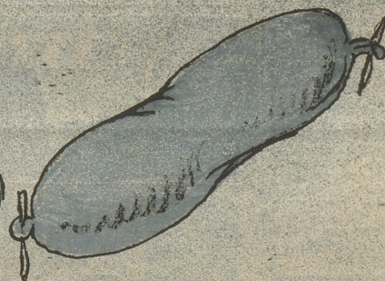
6 Besteuert auch das Schweineblut