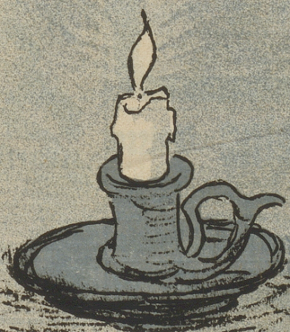
7 Besteuert wird das Kerzenlicht