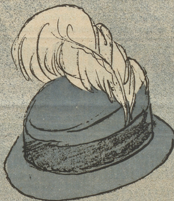
5 Besteuert wird der Dämenhut