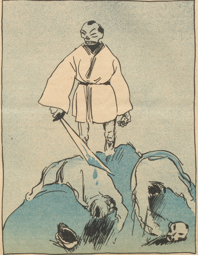
In Asien geht alles programmäßig vor sich. Dieses kleine Scheusal da rollt sich à tout prix zur „gelben Gefahr“ entwickeln.