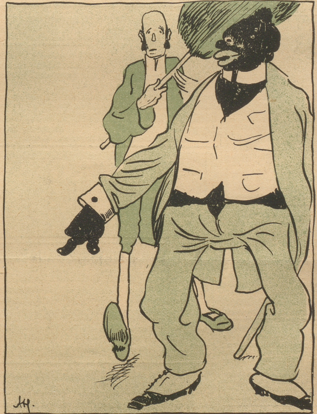
In Afrika sieht es lieblich aus. Die reichen Neger, hochmütig und stolz, weil sie die Freiheit, die Kultur und die Sitlichkeit gerettet haben, halten sich nur mehr weiße Sklaven. O weh!! aber der Respekt ist für immer dahin.