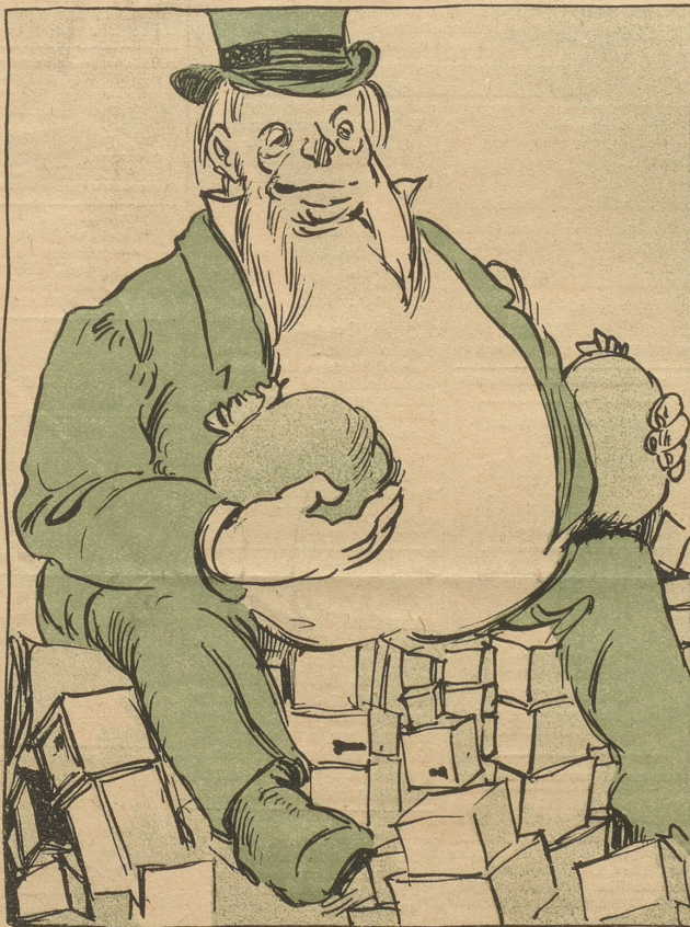
Amerika erkennt man kaum wieder; die aufgestapelten Lebensmittel und das viele Gold haben es so dick gemacht, daß es bald platzen muß. Köstlich platzt es bald und wir kriegen etwas von dem Gold und den Lebensmitteln.