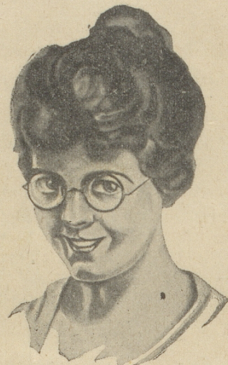
Die Brille dem Geschmack zur Wahl, Als Brillenglas nur Zeiss Punktal!

Zähringerstr. 16 empfehlen Ihre nur la Weina Frau B. Frey, früher Büffet St. Margrethe