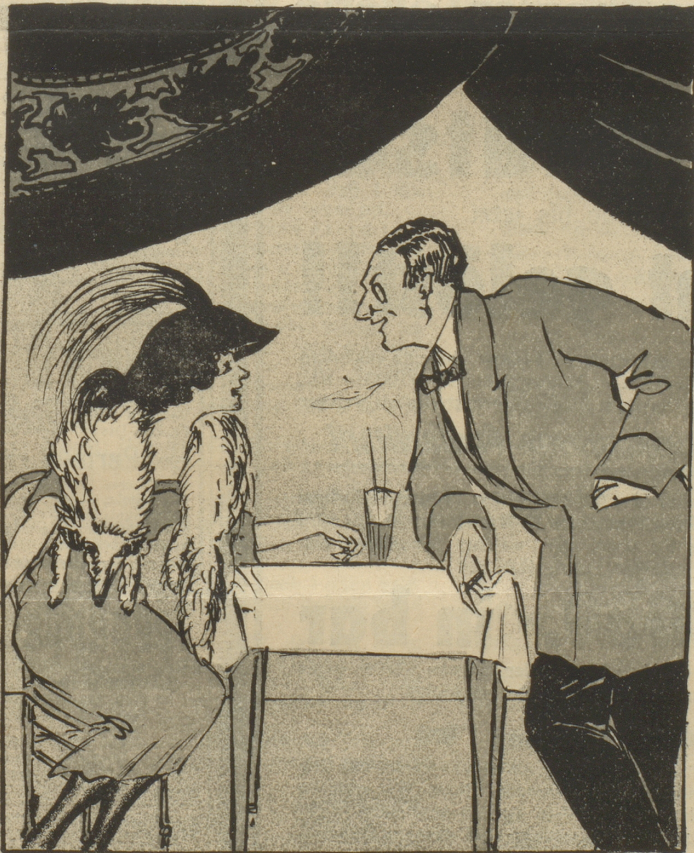
Sie kokettiert mit einem Gent, Der sich entpuppt als Graf am End'.