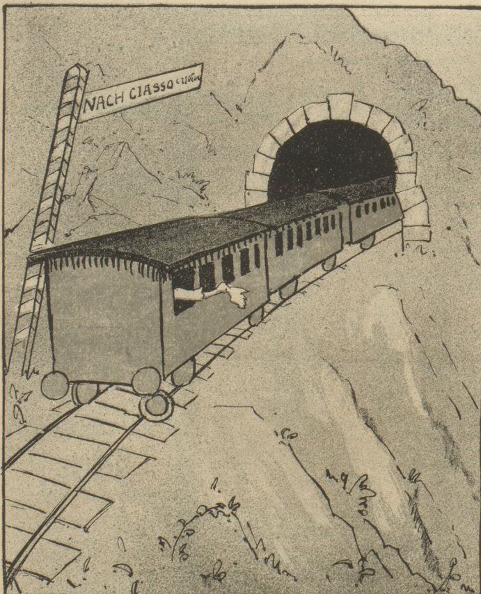
„Für 'ne Valutareise, ach, schlägt nur mein Herz!“ Seufzt sie und gondelt schon Chiassowärts.