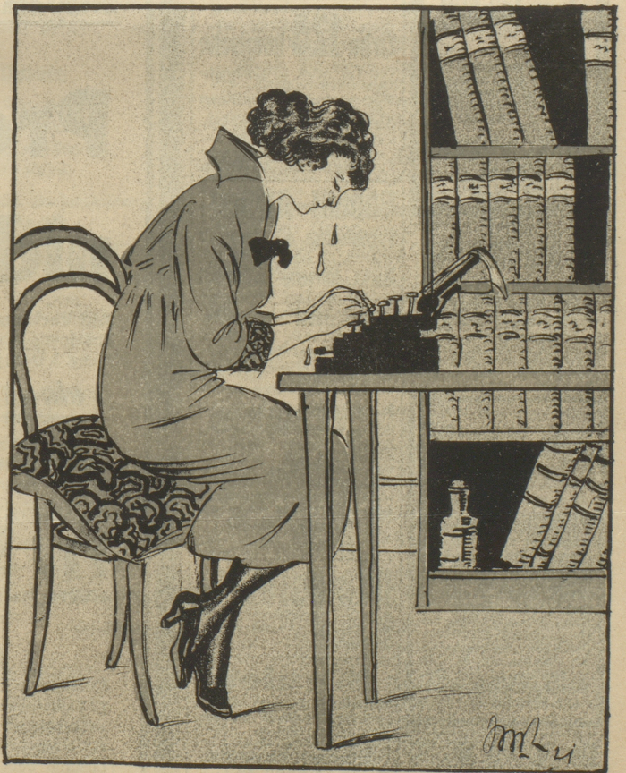
Doch der Erfahrung Schule ist stets bitter, Und schief ging's auch mit Gretlis Ritter! Deshalb sitzt sie wieder im Büro Zum ersten bis zu ultimo. 'n stille Träne rinnt um Barschaft und um Graf; Mehr wie Valuta-Prinzeß fühlt sie sich als Schaf!