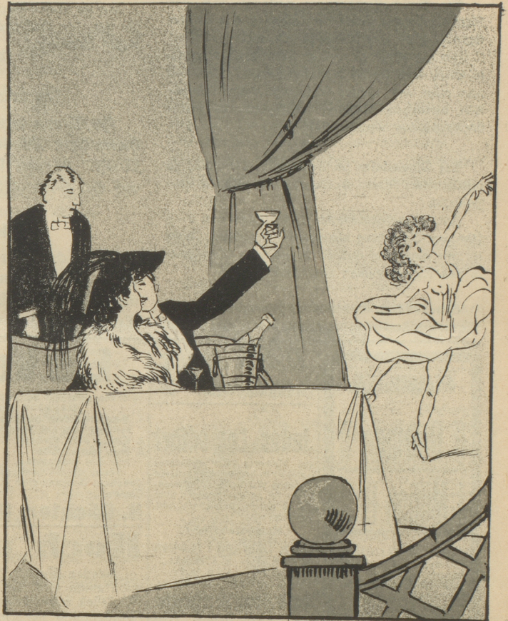
Nur auf Berlin noch schwört sie, wie gar viele, Und bald schwebt dort sie in der Linden-Diele.