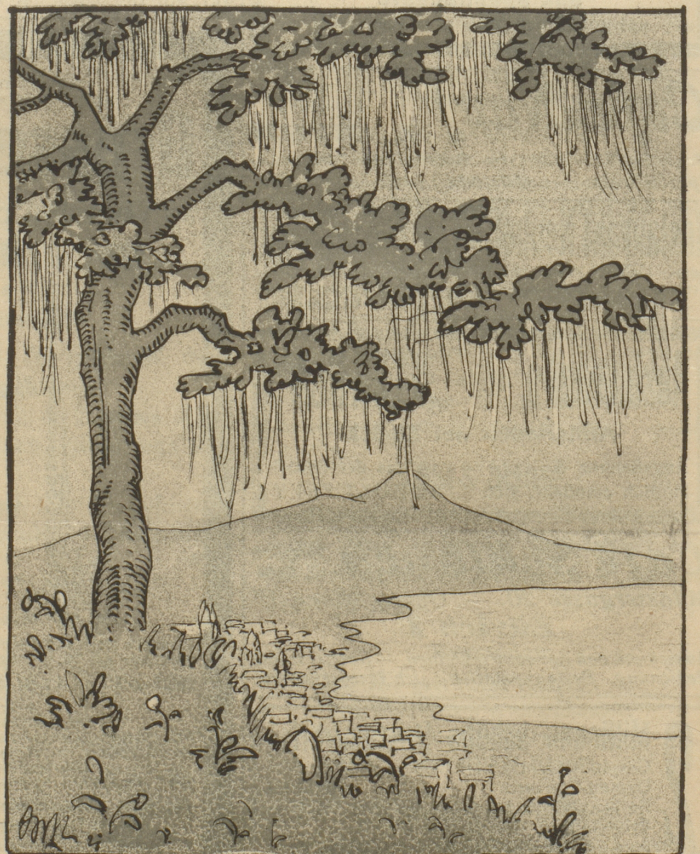
Im Geiß erscheint Neapel und die Lazzaroni, Sie sieht an Bäumen wachsen Maccaroni.