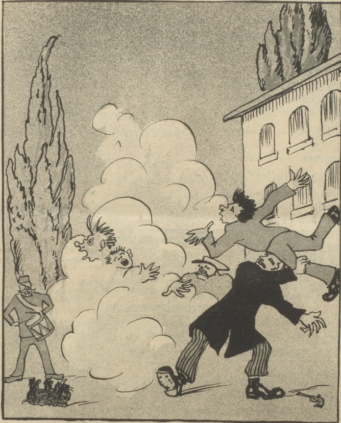
Doch schnell beendet wird der Bummel; Gar rüß ist der Saszistenrummel.