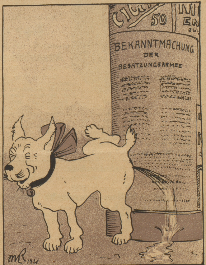
Wegen Verhöhnung und ungebührlichen Benehmens durch den Hund Bobbi, verfährt an einer Bekanntmachung der Okkupationsarmee.