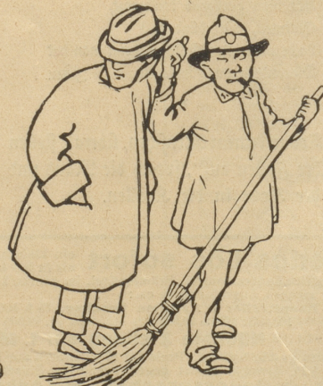
Zeichnung von Carl Czernien

Ich schlenderte planlos durch die Straßen der Stadt St. Gallen, gelangte so vor das Kloster und sah dann das Regierungsgebäude, in welchem sich scheinbar der Große Rat wieder zu einer Session zusammengelassen hatte. Während ich gehobenen Hauptes die Front des Amtsgebäudes abließ, stieß ich auf der Höhe des Großeratsgebäudes auf etwas Hartes und beim Nähergehen wahrte ich ein kostbares künstliches Gebiß. Einen gerade in der Nähe seines Amtes waltenden Straßenkehrer fragte ich ganz unbefangen, wem wohl dies herrenlose Gebiß gehören möchte, worauf er mir ins Ohr flüsterte: „Das g'hört