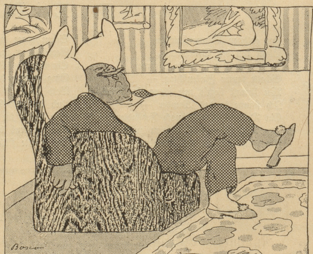
zu Hause viel bequemer.“