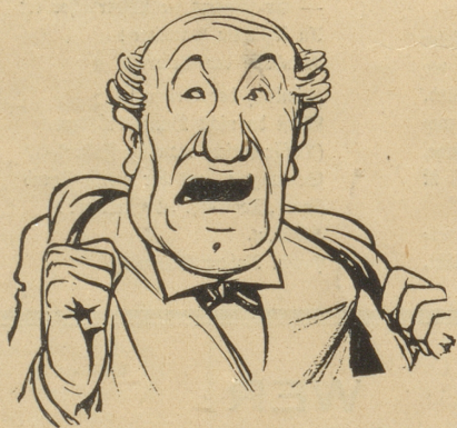
jedefalls wieder amene Großtrot, wo z'breitspurig zum Fenster use g'redt het*. R. G.