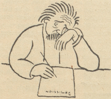
Briand: „Nie mehr werde ich mit Lloyd George Golf spielen! . . .“