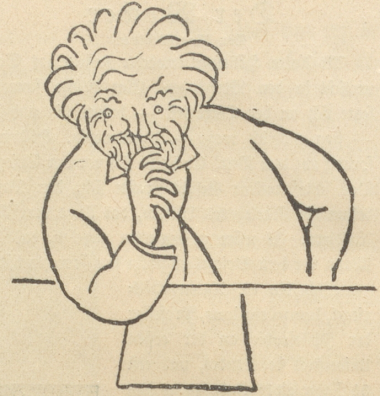
Lloyd George: „Wir werden noch Golf spielen!“ —