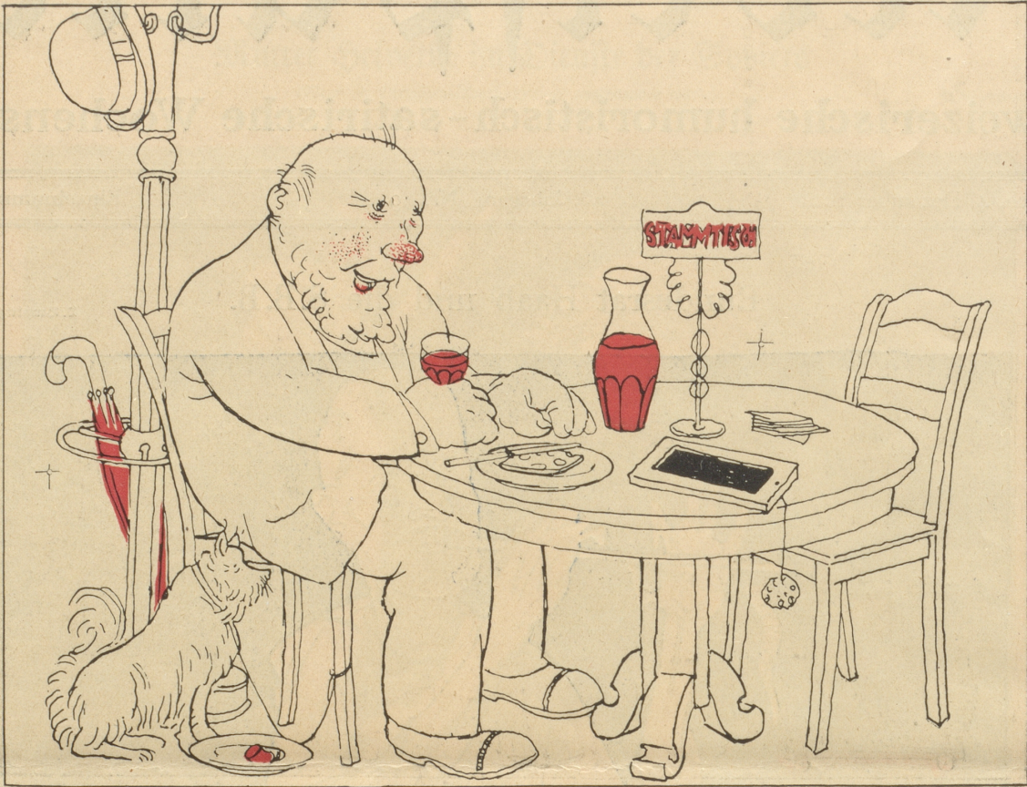
Das ist wahrhaftig schwer und bitter: Vom Stammisich und vom halben Liter