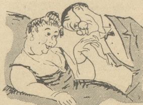
und daß die Kunsthändler Frauen haben.