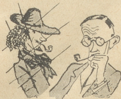
Will man ein bekannter Maler werden, so breche man mit der Vergangenheit.