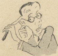
Man schneide sich wie van Gogh das Ohr ab.