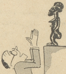
Man schwärme für die Negerkunst.