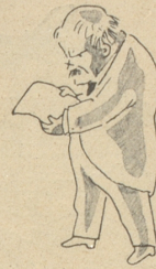
durch Memoranden und Ultimaten nicht gelungen ist