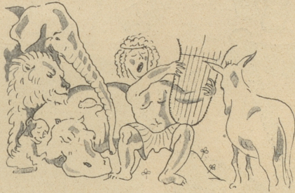
— wäre ihm durch Orpheus Kunst.