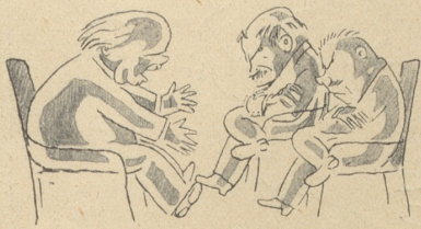
Was Lloyd George durch Privatgespräche,