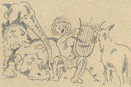
— wäre ihm durch Orpheus Kunst.