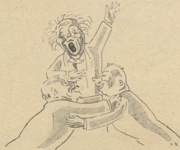
— geglückt. —