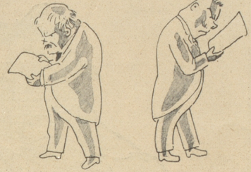
durch Memoranden und Ultimaten nicht gelungen ist