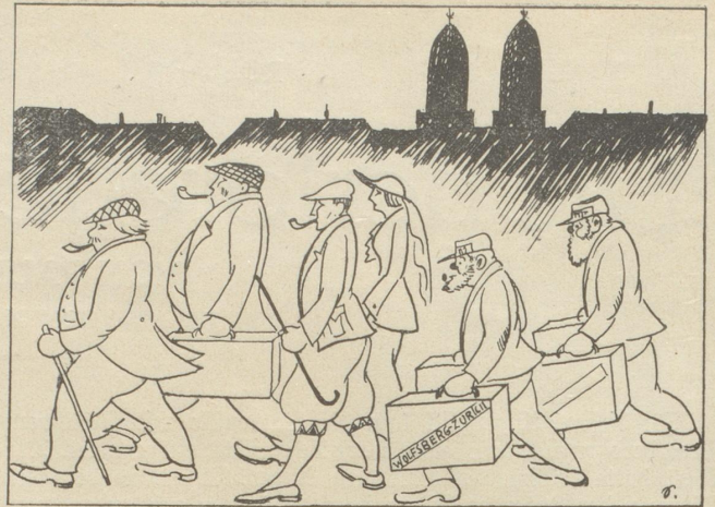
Zufrieden schmunzelnd und wohlgenut geht's wieder heimwärts in festem Schritt. Sie schleppen vergnügt, als höchstes Gut in Koffern englische Graphik mit.

„Natürlich ist es eine Kriegerlist des Gauners. Auf der einen Seite ist es eine Bistienfarte des Spitzbuben, die jeder bei der Polizei sofort erkennt. Er muß seiner Sache sehr sicher sein, daß er es wagt, so offenkundig die Augen auf sich zu lenken. Auf der andern Seite aber ist es doch wieder eine List, die uns die Sache bedeutend erschwert; denn, stellen Sie sich vor, daß die beiden Tücher fast zur selben Zeit verloren oder jagen wir als Köder hingelegt worden sein müssen. Die Patrouille, die Sie, mein Herr, gefunden hat, ist um ein Uhr auf das Wachtlokal zurückgekommen, und der Einbruch an der Gartenstraße wurde um zwei Uhr gemeldet. Die Garten-