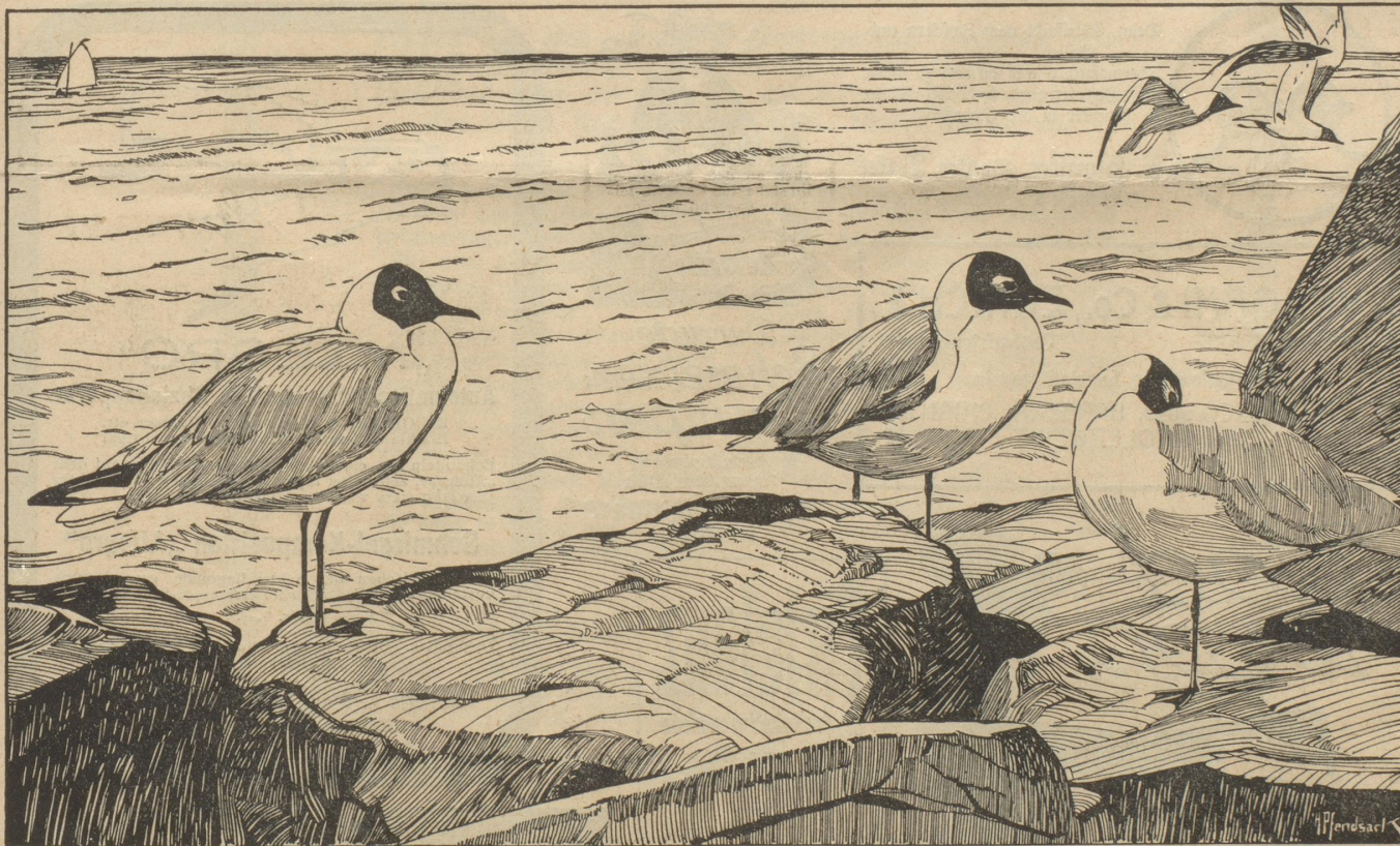
Lachmöven am See

Am Morgen, nachdem man ihn einer zwangsweisen Reinigungsduche unterzogen hatte, wurde er gegen zehn Uhr dem Kommissar vorgeführt, der ihn mit vielen Entschuldigungen entließ und ihm die Versicherung gab, alle Geheimbeamten der Polizei sollten darauf aufmerksam gemacht werden, daß zwei