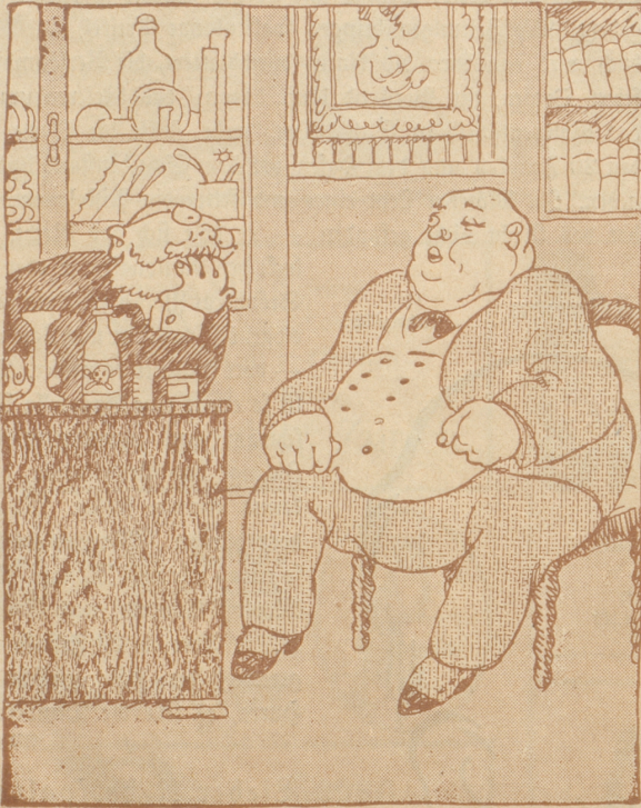
„Sie sollten irgend einen Sport treiben, Herr Späckli, dann werden Sie schon leichter!“