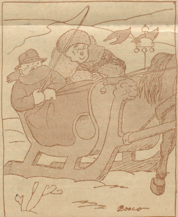
und dem Schlittelsport — bleibt aber immer gleich schwer