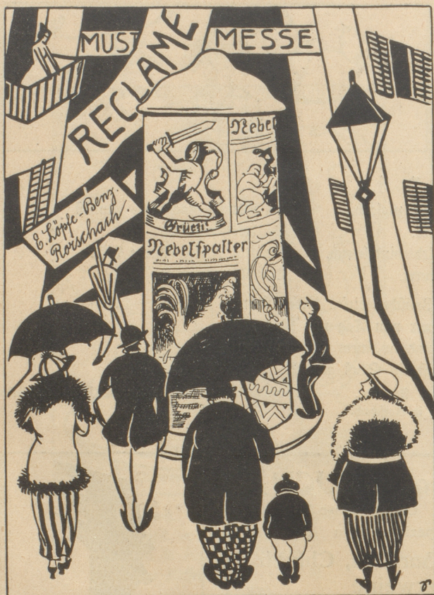
Männer und Kinder und Damen bewundern bei Tag und Nacht die originellen Reklamen, die unser Verlag für sie macht.