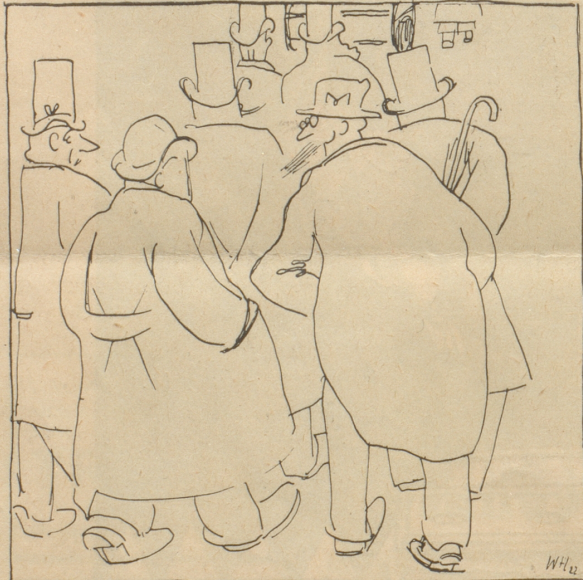
Er het viel in politicibus gmacht, sind Sie öppe —n— über d'Orient-frog au orientiert? „hm hm hm“