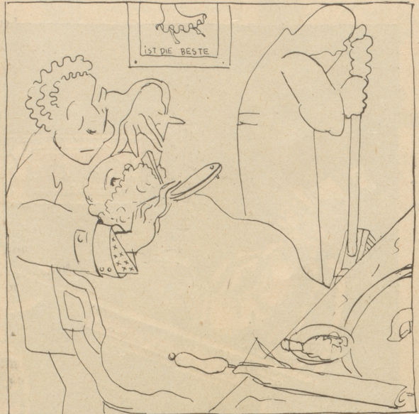
— Im Djent, nda soll widä was los sein, haben Sie eine Ahnung, was? „m — m“