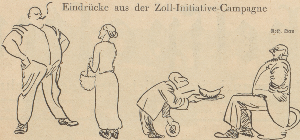
Seine Majestät der Produzent (wie er sich im Kriege ausgebildet hat)