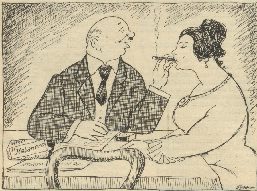
„Gum Mti, hörstsch au en Zug mache — weischt, es isch e „Habanero Weber“ — so ne müß!“

Archibald C. Snob war ein kleiner, sehr runder Herr, dessen Neujährer sorgsamste Wohlgenährtheit verriet. Archibald C. Snob kultivierte diese Wohlgenährtheit, weil sie ihm ein imponantes Neujährer gab — seiner Meinung nach. Er glaubte, sie gehöre zu einem Direktor der Nationalbank wie zu einem Filmschauspieler das Einglas. Und er