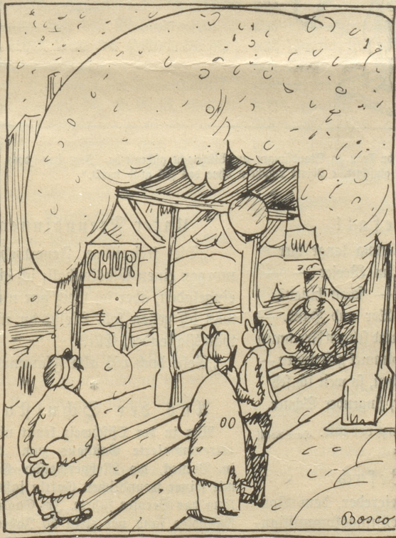
Es nimmt mich nu wunder, wie lang das no hebt? —