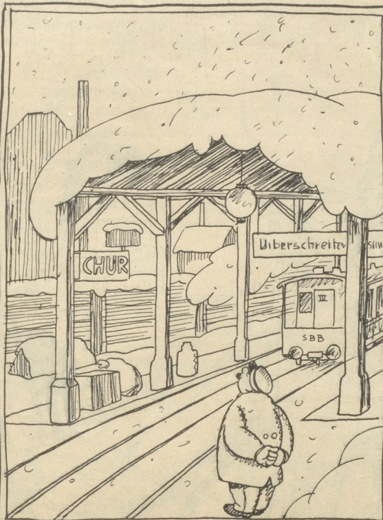
Viel Schnee — — —

Dieselblöcke ist eines Nachts unter der Schneelast, die drei Wochen auf ihr ruhte, ohne daß man Zeit und Gelegenheit fand, sie wegzuräumen, jählings eingestürzt