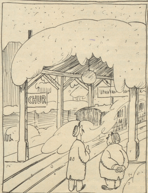
Meinscht das Dach mag dä Schnee träge?