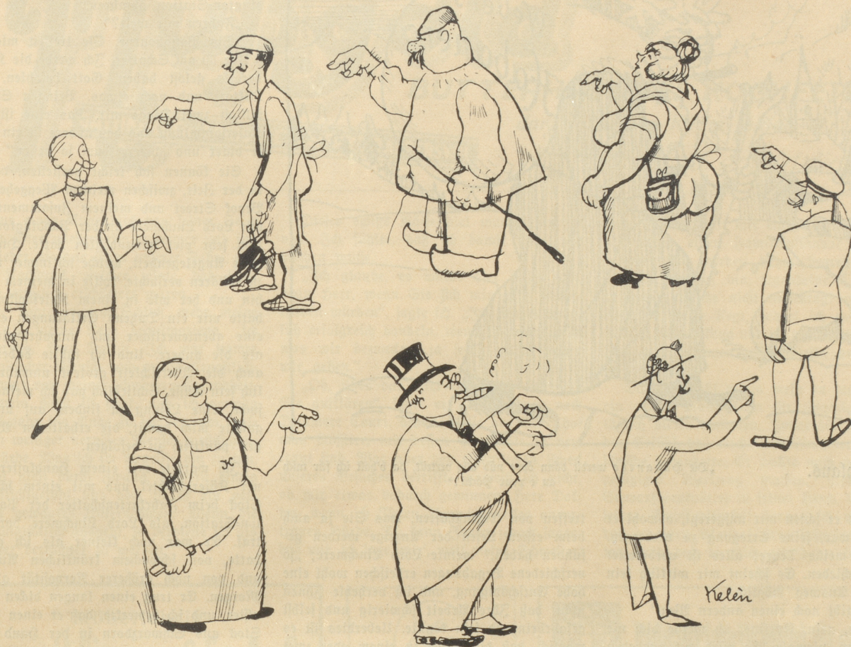
Ein jeder, der es irgendwie kann — gibt einem andern die Schuld daran.