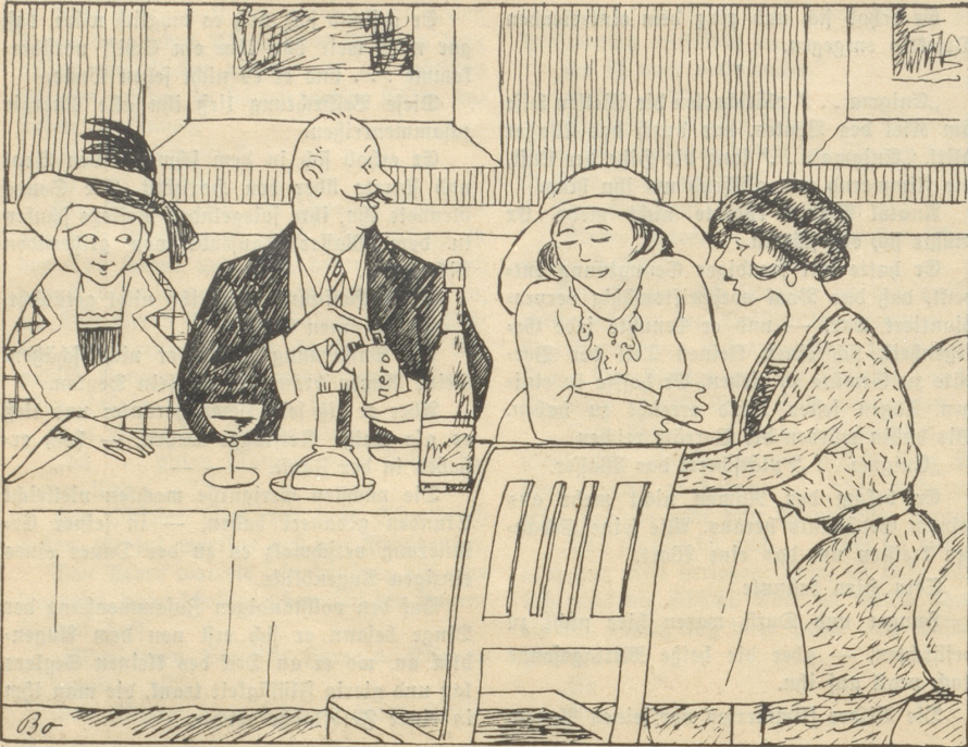
„Wänn ich e mol hürote, mues mi Frau“ grad e so si, wie „Weber's Habanero-Stümpe“: E netti Verpackig — fin und mild, dörf mi nid z'viel choschte, und mues besser si, wie alli andere!“

Um sich sah er ein paar Neger, einen Kreolen und zwei Weiße von spanischem Typ. „Nach Venezuela?“ fragte er. Einer der Weißen bejahte es. Da setzte sich Anatol Pigeon, der sich schon nahezu erholt hatte, auf eine Taurolle und sagte: „Ich habe zwei Tage und zwei Nächte hindurch gerudert. Setzt lassen Sie mich schlafen.“