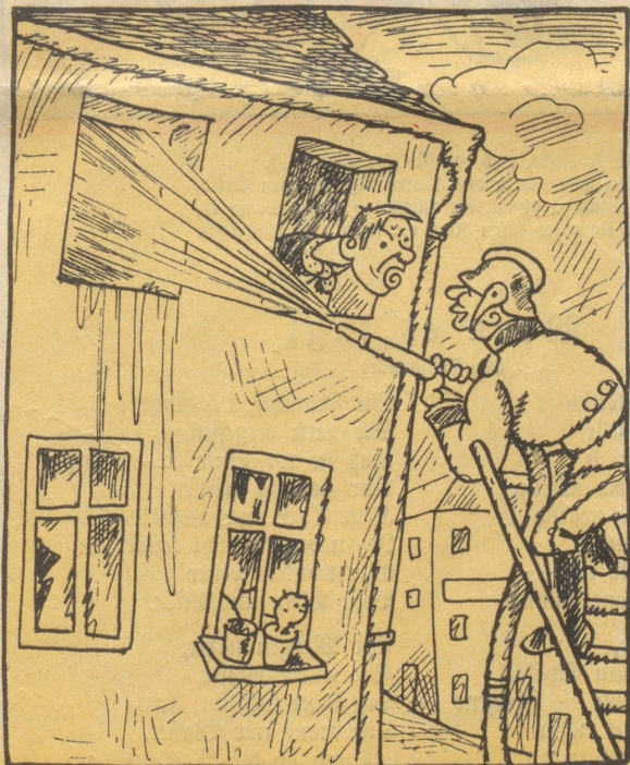
„Heda! es isch ja scho lang glöschet gfi, bis Ihr cho sind!“ „Me häd eus grüest und jekt wird gschprüzt!“