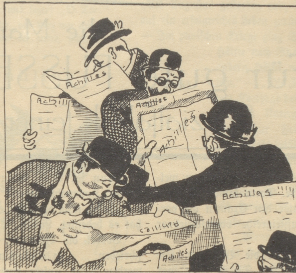
Soeben lese ich es, der neue elektrische Staubfänger Achilles, großartig!