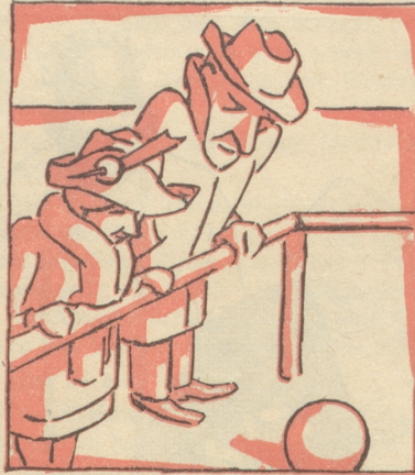
Am Sonntag besucht man bei eisiger Kälte einen Fußballmatch zugunsten invalider Schiedsrichter.