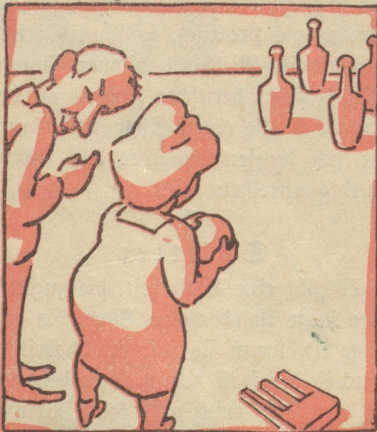
Am Freitag nimmt man teil an einem Bazar zugunsten notleidender Künstler, verbunden mit einem Preisregeln für Damen.