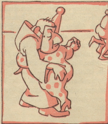
Am Samstag ist Kostümfest mit internationaler Tanz-Konkurrenz zugunsten des Vereins für Bekämpfung des Geburtenrückganges. Da darf man nicht fehlen.