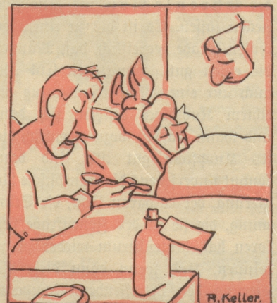
Dann hört die tätige Nächstenliebe einströmen auf. Man ist erschöpft, liegt im Bett und trinkt Medizin zugunsten der erschlafenen Lebensgeister.