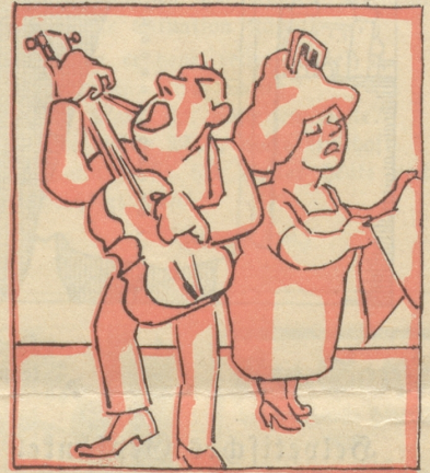
Am Donnerstag ist bunter Abend zugunsten der Ruhrhilfe. Da tritt man selber auf und singt ein französisches Chanson.