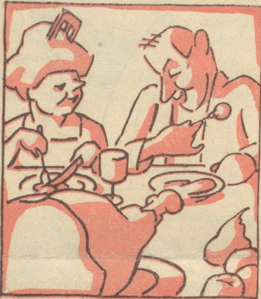
Am Dienstag füllt man sich den Magen an einem Wohltätigkeitsfest zugunsten des Institutes für Rassenverbesserung.