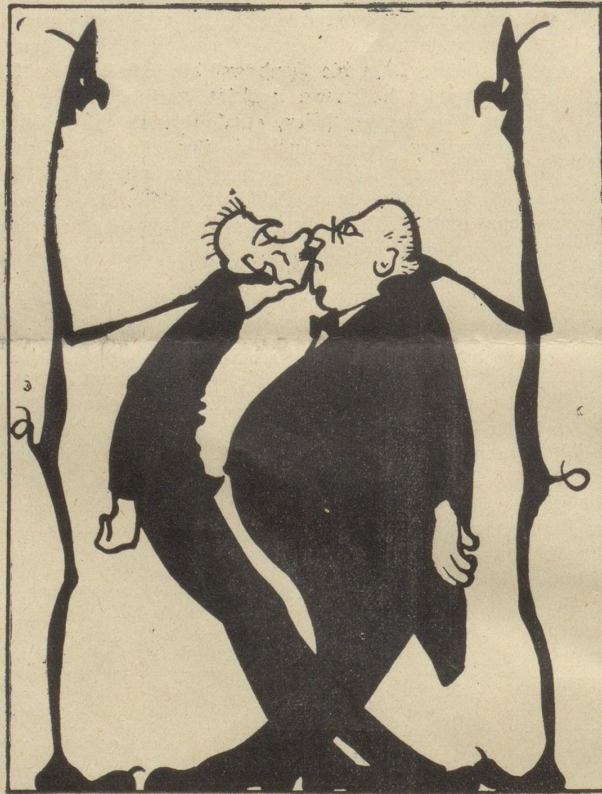
für zwei, die sich im Leben nicht sehen und riechen konnten.“