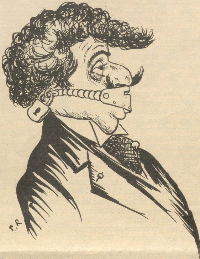
Der italienische Tenor während seiner Schweizer-Tournee mit einer speziellen Vorrichtung gegen die Beschagnahme seiner Stimme durch die Zürcher Behörde.

(In der leidlich peinlichen Affäre Stamm-Toscanini [Scala-Orchester] wurden den italienischen Musikern, die durch die Nachenschaften Stamms schon genügend geschädigt waren, von Zürcher Behörden auch noch die Instrumente mit Beschlag belegt.) Rabinovitch