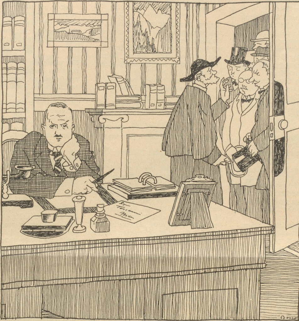
Nei, dä Herr Bundesrat Motta hat jetzt keine Zeit. Er studiert gerade wieder an einer neuen Entschuldigung umen."

(Herr Bundesrat Motta hat es auch noch notwendig gefunden, sich bei seiner Majestät, dem Maestro in Mailand, zu entschuldigen)