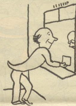
„Jetzt gehen Sie ins Kreisgebäude.“