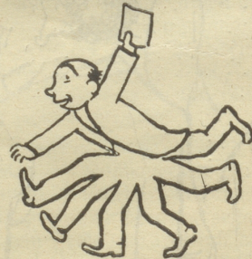
läuft her — — —