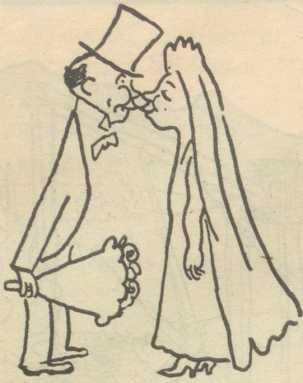
„Und jetzt hole ich rasch unseren Paß für die Hochzeitsreise.“