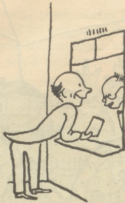
„Bitte um einen Auslandspaß für mich und meine Frau.“ „Schalter 93 und wieder hierher.“