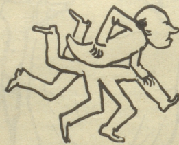
Und der glückliche Ehemann läuft hin,