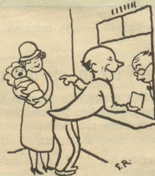
läuft solange, bis er endlich einen Paß für drei Personen verlangen muß.