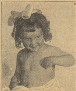
„Die Kleine, vordem etwas blass, ging auf wie ein Röschen . . . Schliesslich ovomaltinte die ganze Familie.“

In diesem Sinne bedeutet eine Tasse Ovomaltine ein Fest für Mund und Magen. Hochwertig, leicht verdaulich, angenehm von Geschmack, führt sie dem